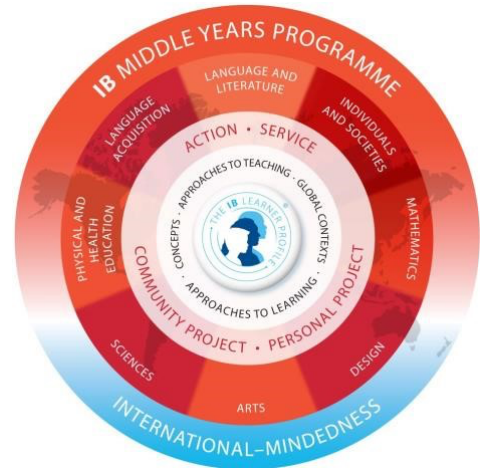
Het MYP curriculum model